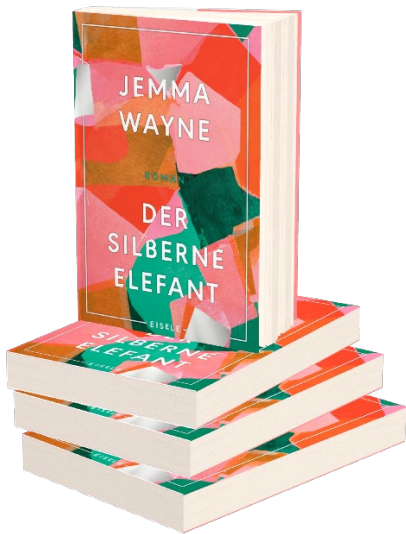
eMotion: Produktabbildung Softcover