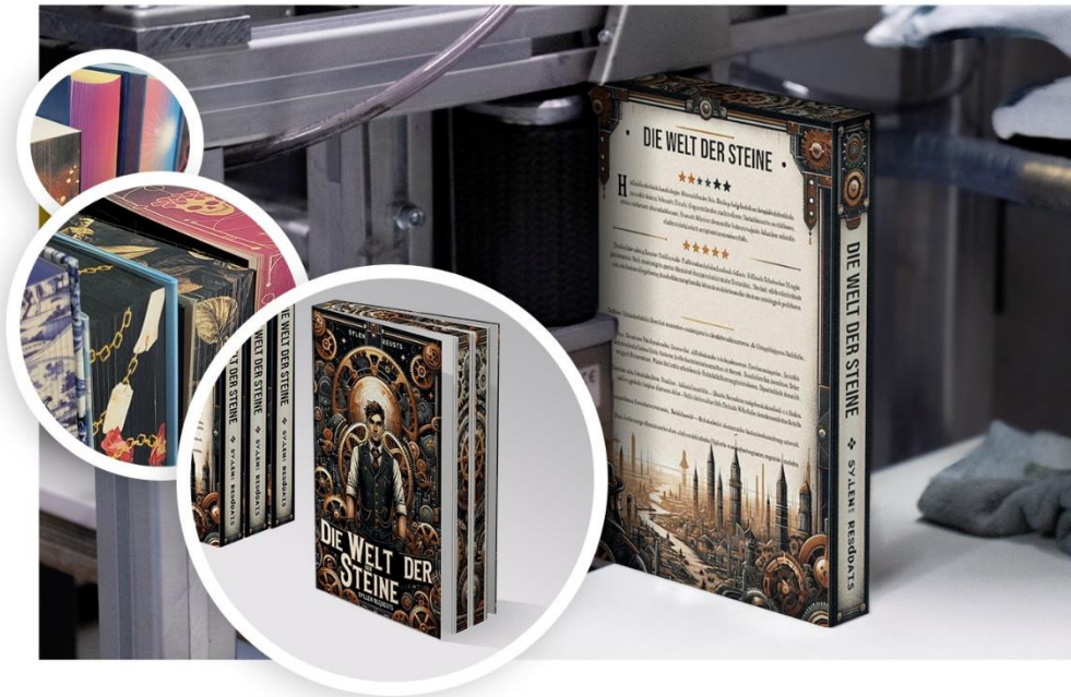
Digitaler Farbschnitt - Buchkantendrucker mit Muster